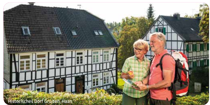
Historisches Dorf Gruiten, Haan