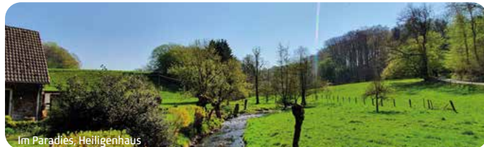
Im Paradies, Heiligenhaus

Abwechslungsreiche Route rund um Heiligenhaus. Am Wald- und Wassermuseum vorbei und durch die malerischen Naturschutzgebiete Rinderbachtal und Vogelsangbachtal zurück zum Ausgangspunkt. Treffpunkt: Hofcafé Abtsküche, Abtskücher Straße 40, Heiligenhaus | Kosten: kostenfrei | Anreise: Begrenzte Parkmöglichkeiten an der Abtskücher Straße. Anreise mit Buslinien 772 und 774 an Haltestelle Abtsküche. (empfohlen) | Verpflegung: gemeinsamer Abschlussimbiss mit Getränken / Die Kosten sind selbst zu tragen. | Gästeführer: Landrat Thomas Hendele | Veranstaltende: Kreis Mettmann, Tel. 02104 99 2078, E-Mail: info@neanderland.de