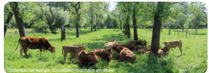
Urdenbacher Kämme, Düsseldorf/Monheim am Rhein