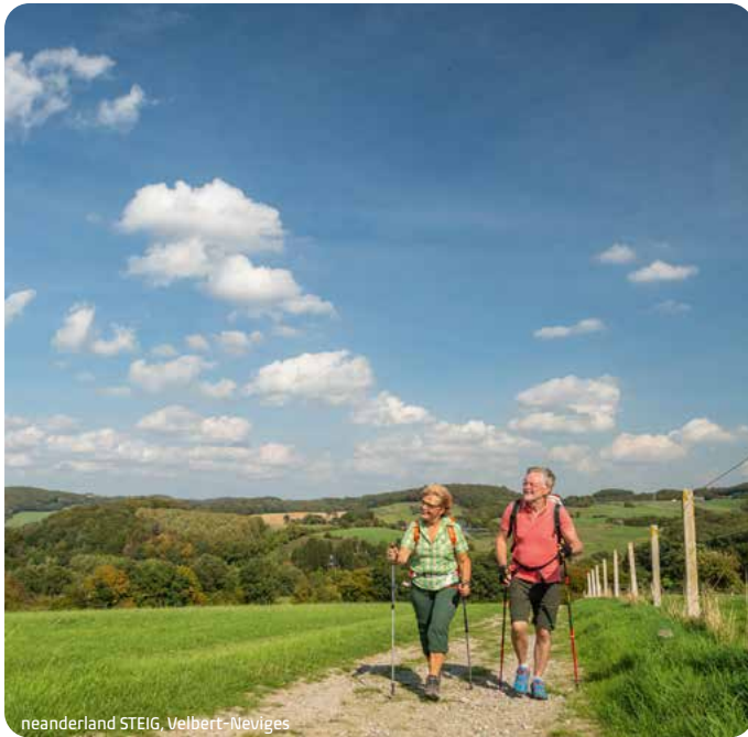
neanderland STEIG, Velbert-Neviges

Tel. 0151 58243623, E-Mail: ertl.markus@gmx.de