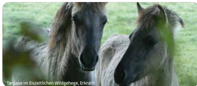
Tarpans im Eiszeitlichen Wildgehege, Erkrath